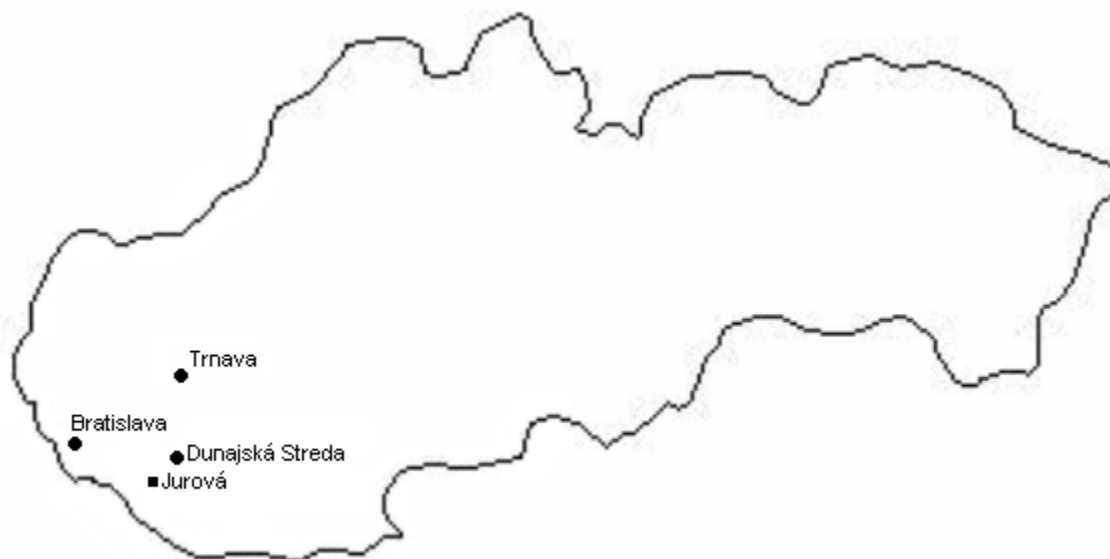
Mapa 1: Poloha obce Jurová na Slovensku vo vzťahu k hlavnému mestu, krajskému centru a obvodnému/okresnému mestu